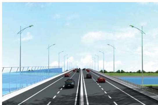
Cầu Việt Trì mới sẽ hoàn thành vào năm 2015

Dự án gồm phần cầu Việt Trì mới nằm trên Quốc lộ 2, bắc qua sông Lô, phần đường dẫn phía Vĩnh Phúc, Phú Thọ và các cầu trên đường dẫn, có tổng chiều dài cầu và đường hơn 3,7 km (đoạn vượt sông dài 736 m) được thiết kế bằng bê tông cốt thép. Nhịp cầu chính dạng dầm hộp liên tục bằng bê tông cốt thép dự ứng lực. Bề rộng cầu 22,5 m (gồm 4 làn xe cơ giới 14 m; 2 làn xe hỗn hợp 6 m, dải phân cách cứng ở giữa và dải an toàn 1,5 m; gờ lan can 2 bên 1 m). Đường dẫn hai đầu cầu rộng 24 m. Tổng mức đầu tư của dự án giai đoạn này là 1.900,548 tỷ đồng. Dự kiến sau 18 tháng thi công sẽ hoàn thành.